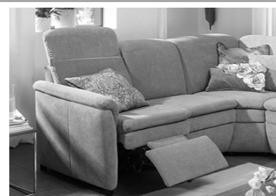
motorische Relaxfunktion (Mehrpreis, Kopfteilverstellung empfohlen)