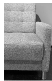
AT V2 - bodenfrei