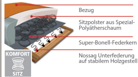
Komfortsitz mit Federkern