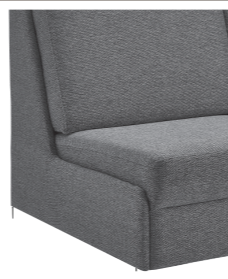
Abschlussblende alternativ zu einem Armteil möglich (Mehrpreis)