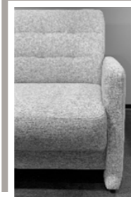
AT V1 - bodennah