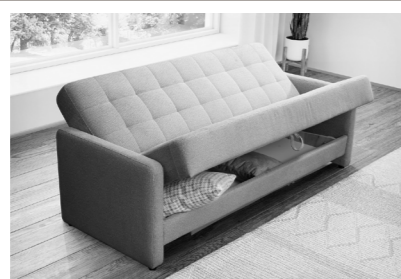
Kipper mit Stauraum im Bettkasten