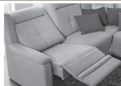
motorische Relaxfunktion (Mehrpreis, Kopfteilverstellung empfohlen)