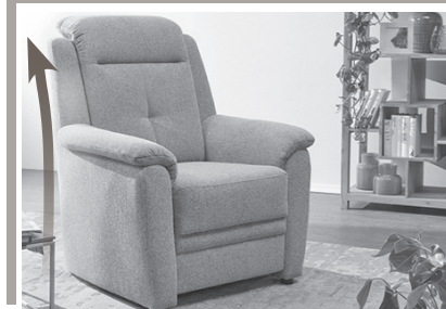
Extra hohe Rückenlehne