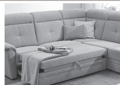
Querschläfer (Mehrpreis, Auszug ist optional im Originalbezug (echt) möglich)