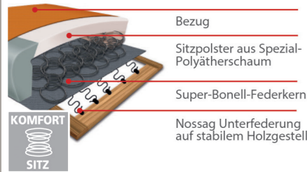
Komfortsitz mit Federkern