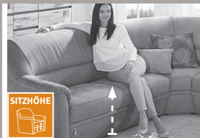
3 Sitzhöhen zur Auswahl

3 Sitzhöhen durch unterschiedlich hohe Möbelgleiter. Nicht möglich bei Funktionselementen. Dadurch ändert sich auch die Rückenhöhe.