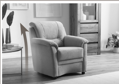
Niedrige Rückenhöhe Ideal für Stellplatz unter Fenster oder Dachstrahlen!