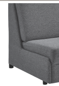
Abschlussblende alternativ zu einem Armteil möglich (Mehrpreis)