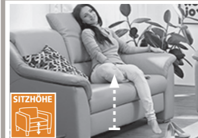
3 Sitzhöhen zur Auswahl