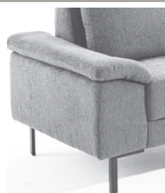
AT - Optik