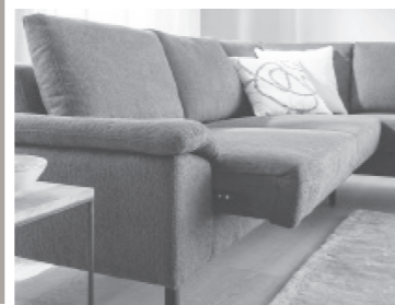
motorische Vorziehfunktion (optional)