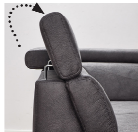
Kopfteilverstellung incl. Höhenverstellung optional erhältlich. Bitte bei Bestellung angeben und Mehrpreis beachten.