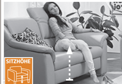
3 Sitzhöhen zur Auswahl