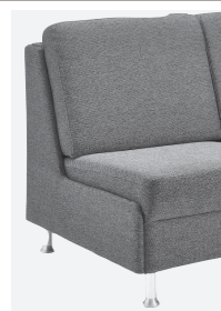
Abschlussblende alternativ zu einem Armteil möglich (Mehrpreis)