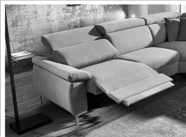
motorische Relaxfunktion wandfrei